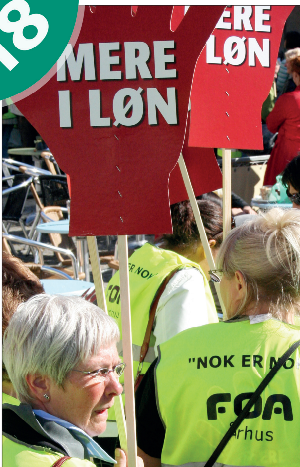
FOAs medlemmer har et lønofferslæb og fortjener markante lønstigninger ved overenskomstforhandlinger i 2018.

- Det skal være besværligt for arbejdsgiverne at inddrage fridage, siger hun og understreger, at det skal være dyrere at ændre i folks vagtplaner.